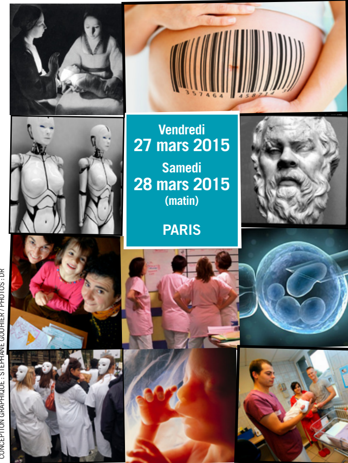
CONCEPTION GRAPHIQUE : STÉPHANE GOUHIER

HISTOIRE - PHILOSOPHIE - PSYCHANALYSE - SOCIOLOGIE - RELIGION - ANTHROPOLOGIE - GENRE - ART